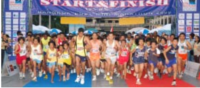
จุดเริ่มต้นและเส้นชัย

ลานหน้า บางกอกคอนเวนชั่นเซ็นเตอร์, โรงแรมเซนทาราแกรนด์ เซ็นทรัลเวิลด์ กรุงเทพฯ (ฝั่งตรงข้ามวัดปทุมวนาราม) เจ้าภาพ : บริษัท โฟสต์ พับลิชซิง จำกัด (มหาชน)